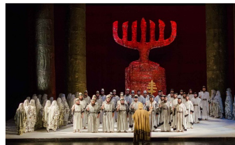
Scenă din NABUCCO